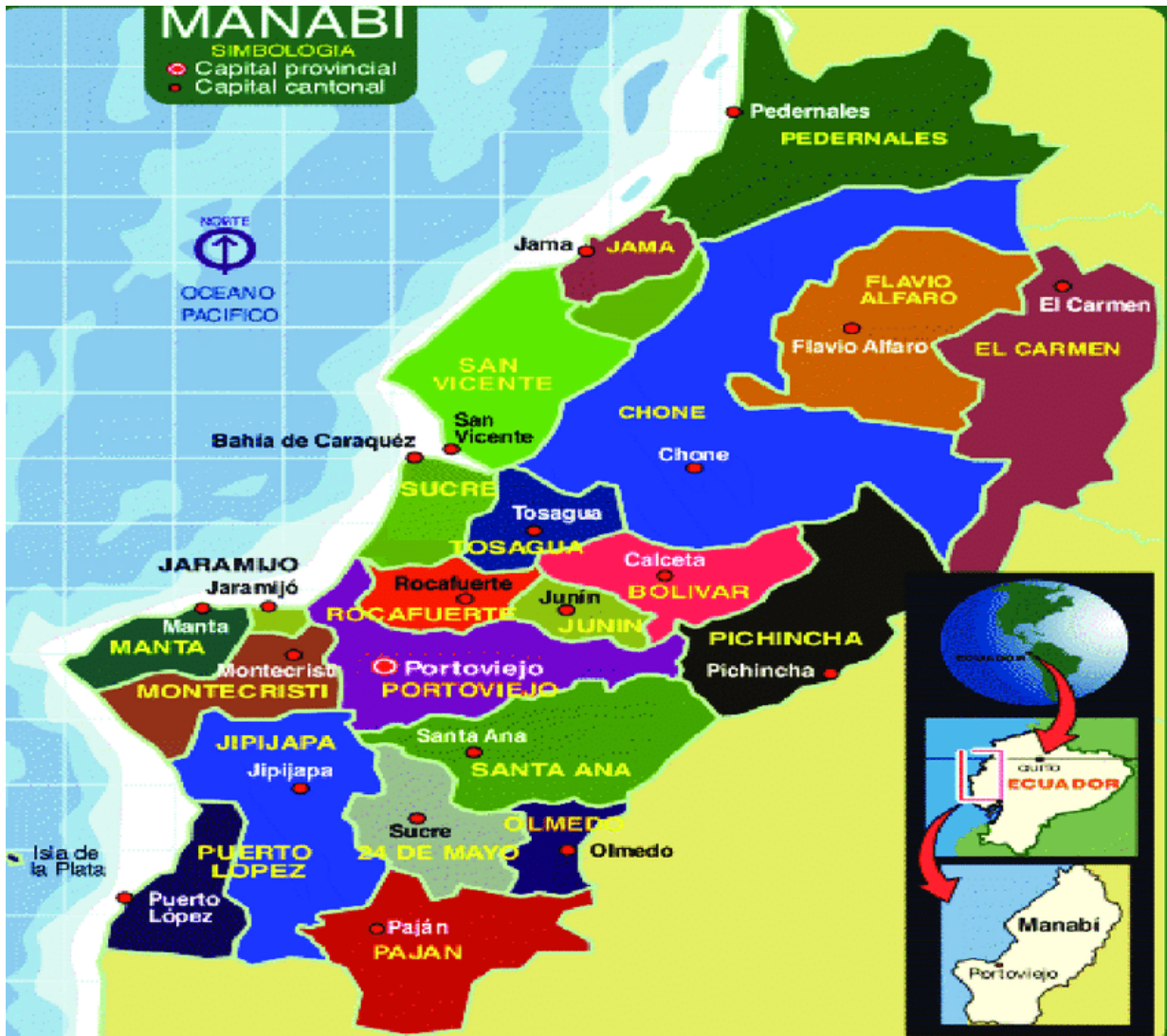
Fig. 1. Mapa político de la provincia de Manabí

Cantones con los que limita el cantón Chone (fig. 1):